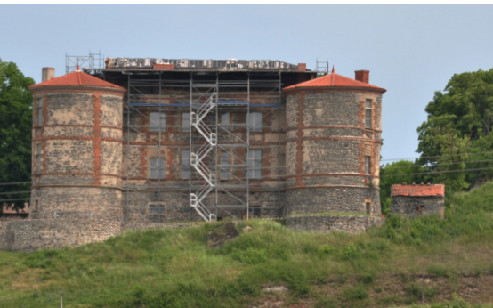
château de La Chaux-Montgros

Artonne Besse et Saint-Anastaise Champeix Châteldon Chauriat La Sauvetat Le Broc Montaigut-le-Blanc Nonette Saint-Floret Saint-Saturnin Sauxillanges